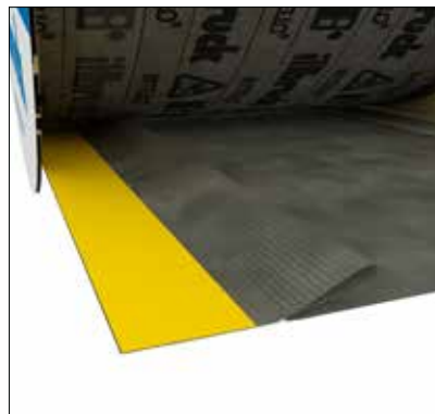
DAFA Duo Foil lysningsfolie er en fleksibel folie, idet den er udstyret med en fold, der kan udvide båndets bredde og derved tage højde for uventede byggetolerancer.

DAFA Duo Foil lysningsfolie tilbyder en 10 års systemgaranti på illbrucks i2 og i3 systemfuger. Garantiordningen omfatter ind- og udvendige fuger samt mellemisolering.