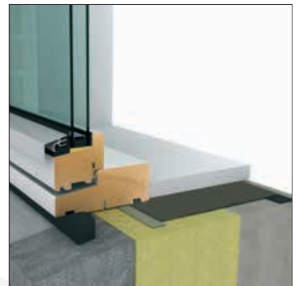
DAFA Duo Foil lysningsfolie i vindueskonstruktion.