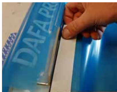
Afriv den ene del af lineren og sæt fast på folien ved gennembrydningen.