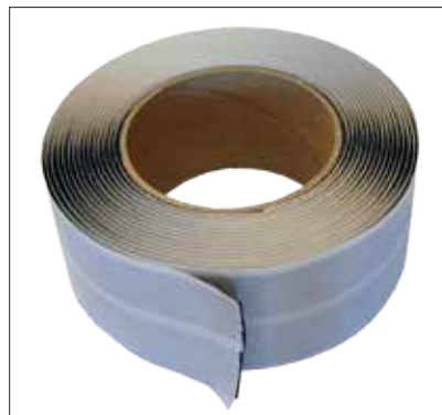
DAFA Multi Sealing.