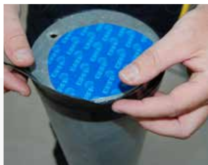
Den anden halvdel af aftrækspapiret fjernes, og DMS vippes op mod folien.