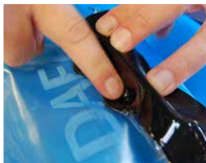
Vip derefter (DMS) over bruddet/emnet og gør fast ved kraftig tryk.