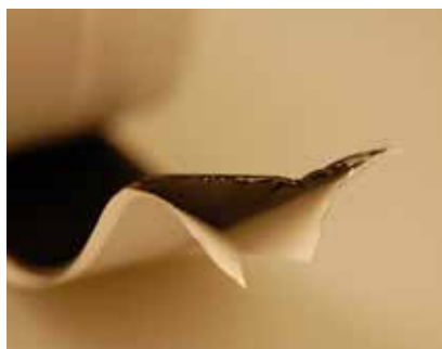
DMS har en 2-delt liner/afrivningspapir, for at lette arbejdet (se eksempler her på siden).