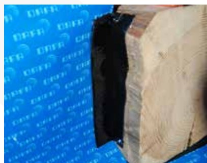
DMS foldes ud og fastgøres på folien.