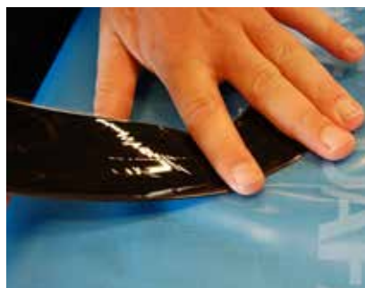
DMS er særdeles fleksibelt og meget nemt at arbejde med.