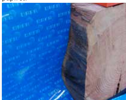
Tætning omkring vanskeligt underlag. Eksempelvis gammelt bjælkelag.