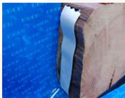
DMS fastgøres på bjælken (fjern den ene halvdel af aftrækspapiret).