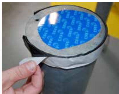
Velegnet til tætning om runde emner. God hæftning på metal. Påfør DMS ved at fjerne den ene del af aftrækspapiret.