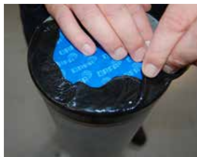
DMS fastgøres nemt hele vejen rundt.