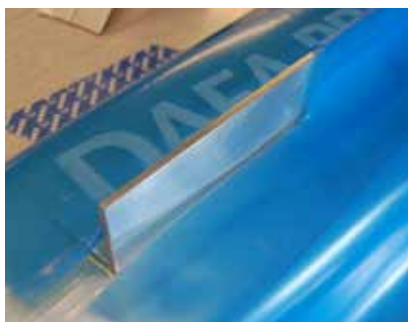
Tætning ved gennembrud i dampspærren.